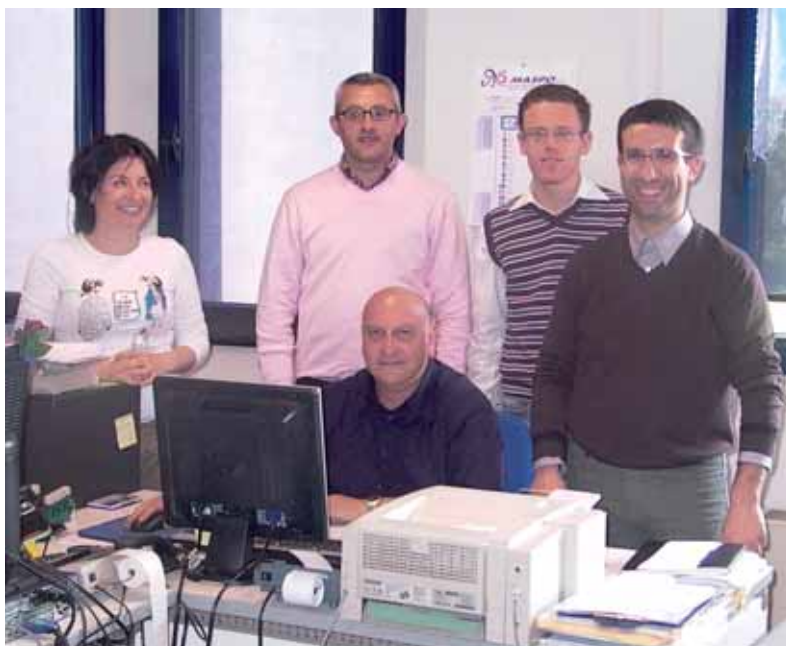
Personale dell'Ufficio Tributi

Va ancora sottolineato che con questi esborsi il Comune ha fortemente incrementato il proprio patrimonio. Per quanto riguarda gli immobili basti pensare a quanto detto fin qui a proposito delle spese sostenute dal Comune in termini di ristrutturazione e acquisto di beni e opere pubbliche per la Città. Le spese per incarichi professionali riguardano i compensi ai professionisti che hanno realizzato i progetti e diretto i lavori precedentemente descritti.