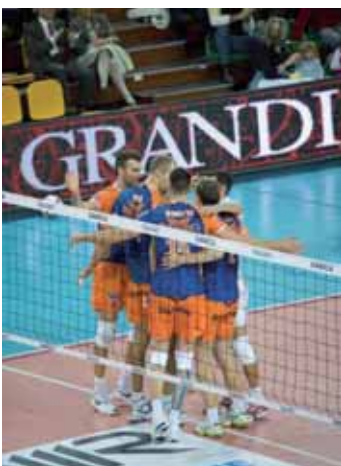
Acqua Paradiso Montichiari