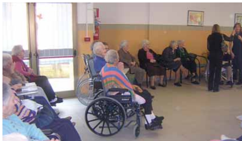
Un momento ricreativo all'ASSOM

Un altro servizio erogato dal Comune è l'assistenza domiciliare (S.A.D.), cioè