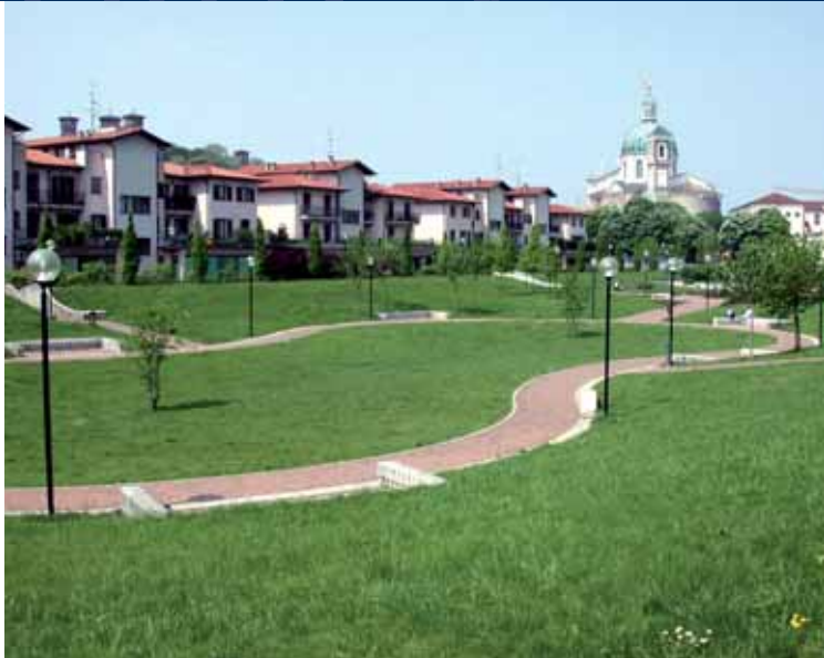
Il Parco City