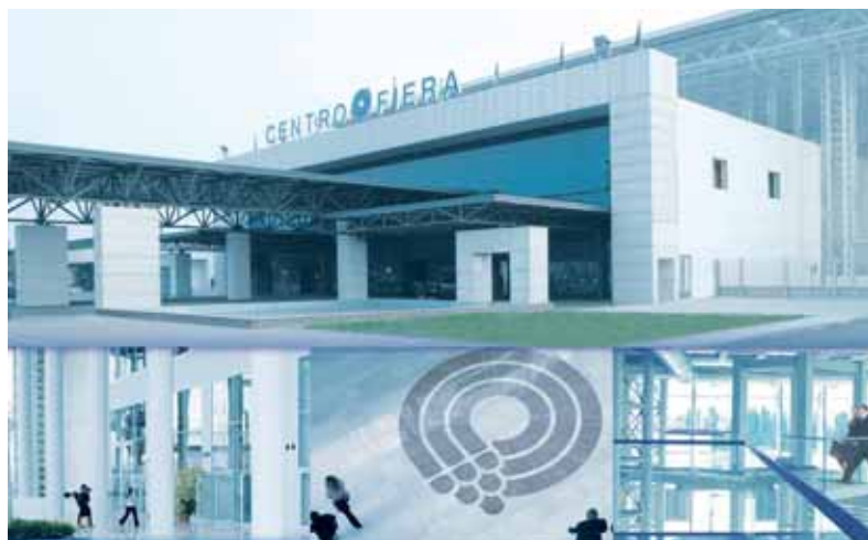
Il Centro Fiera

Il Centro Fiera di Montichiari ospita la rassegna internazionale